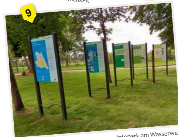
Infopark am Wasserwerk