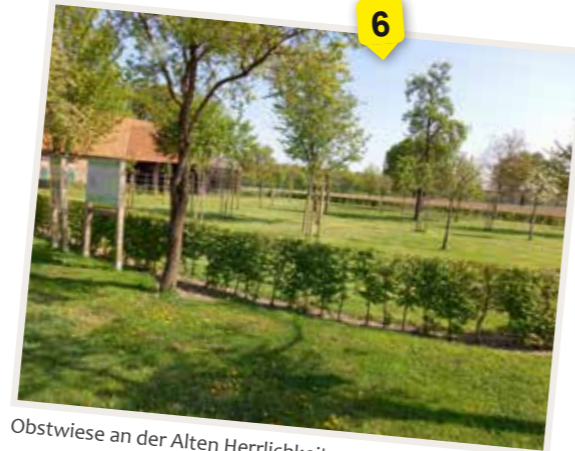
Obstwiese an der Alten Herrlichkeit