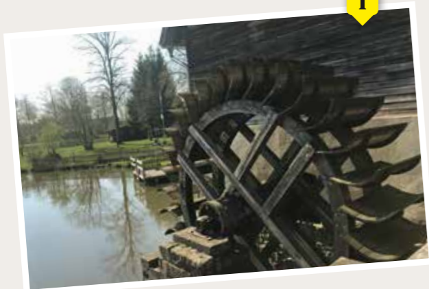
Vinnenberger Wasserrad - Historische Wasserkraftnutzung im klösterlichen Umfeld [Beispiel Infopunkt]